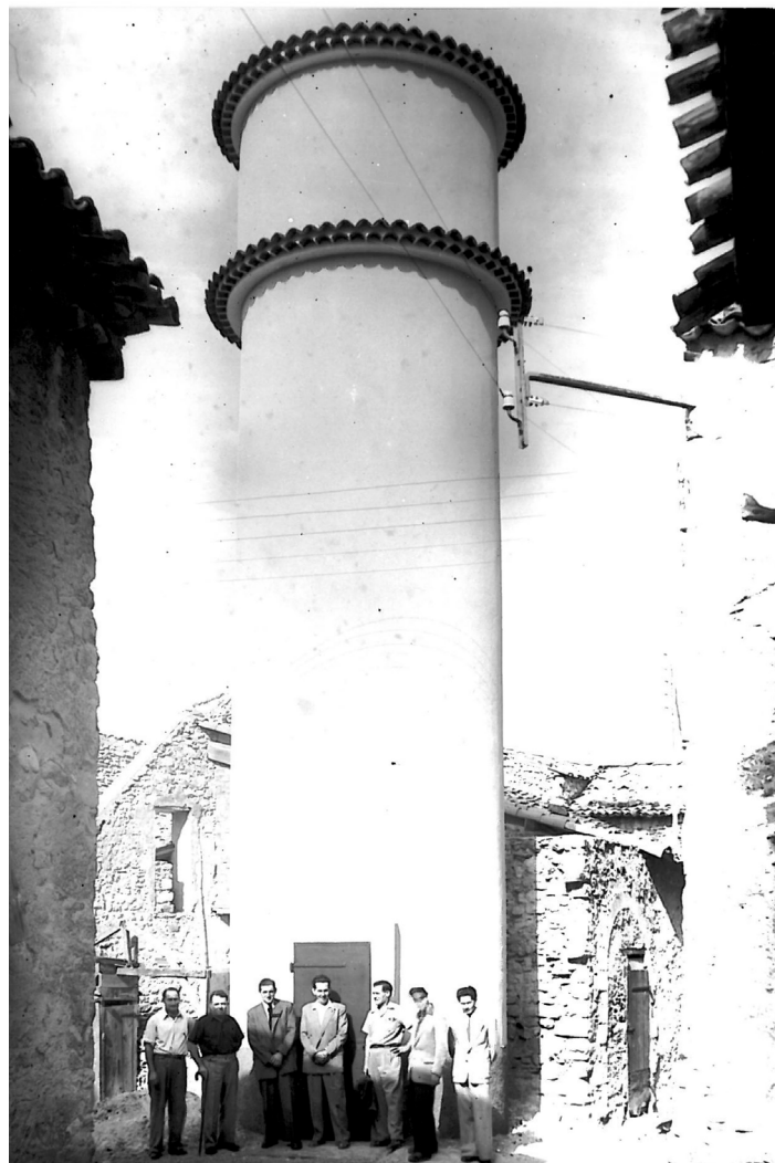
Le château d'eau Pierrevert - 1949 (Archives communales) Photo : Jules Imbert