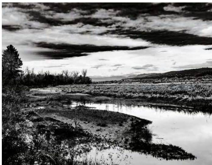
Henri Kartmann "La Durance, voyage imaginaire" Salle de la Frache