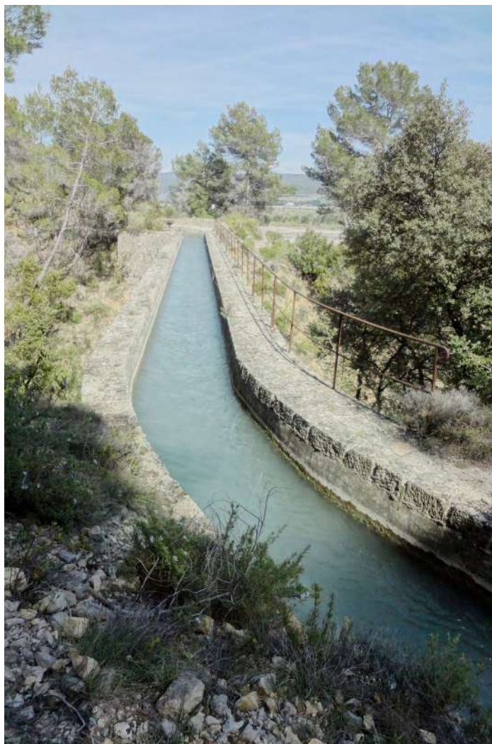
Société du Canal de Manosque "Le canal qui a changé le visage du territoire" Salle de la Frache