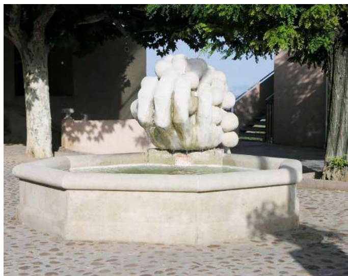
Louis Plantier "Fontaines festives" Salle de la Frache